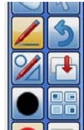
Intuitive Software - Einfache Bedienung

Irrtum, technische Änderungen und Schreibfehler vorbehalten