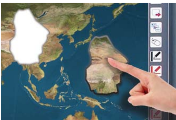
Eingabe durch Finger-, Stift- oder Zeigestab